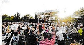
(※)本ツアー代にチケット代は含まれておりません

日：2024年6月29日(土) 場所：読谷村運動場広場 (沖縄県中頭郡読谷村字喜名2976番地) 出演：BEGIN/他 詳細：右記QRコード をご参照ください