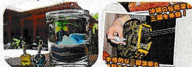
(※)本ツアー代に体験代は含まれておりません