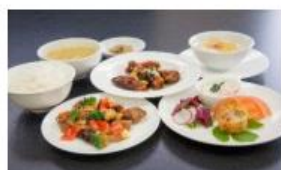
あぐ一豚の四川唐辛子炒め