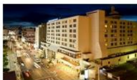
国際通り沿い 牧志駅より徒歩3分