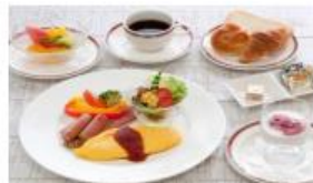
朝食：洋食セットメニュー