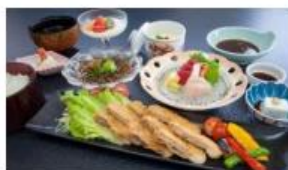
あぐ一豚のトンカツ御膳