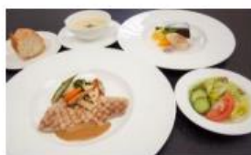
あぐ一豚のグリエ粒胡椒ソース