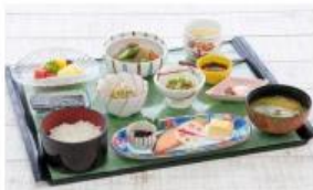
朝食：和食セットメニュー